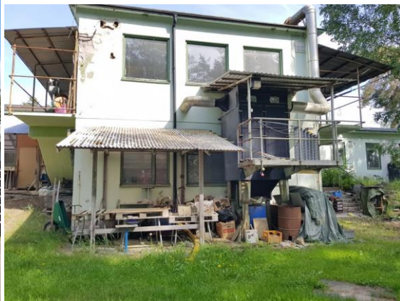
Även utemiljö har städats och huset har målats.