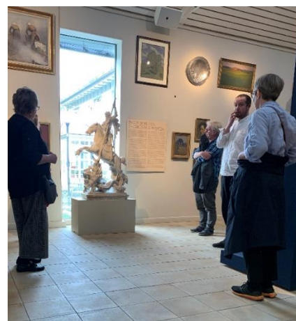
Guidad visning vid Rackstamuséet