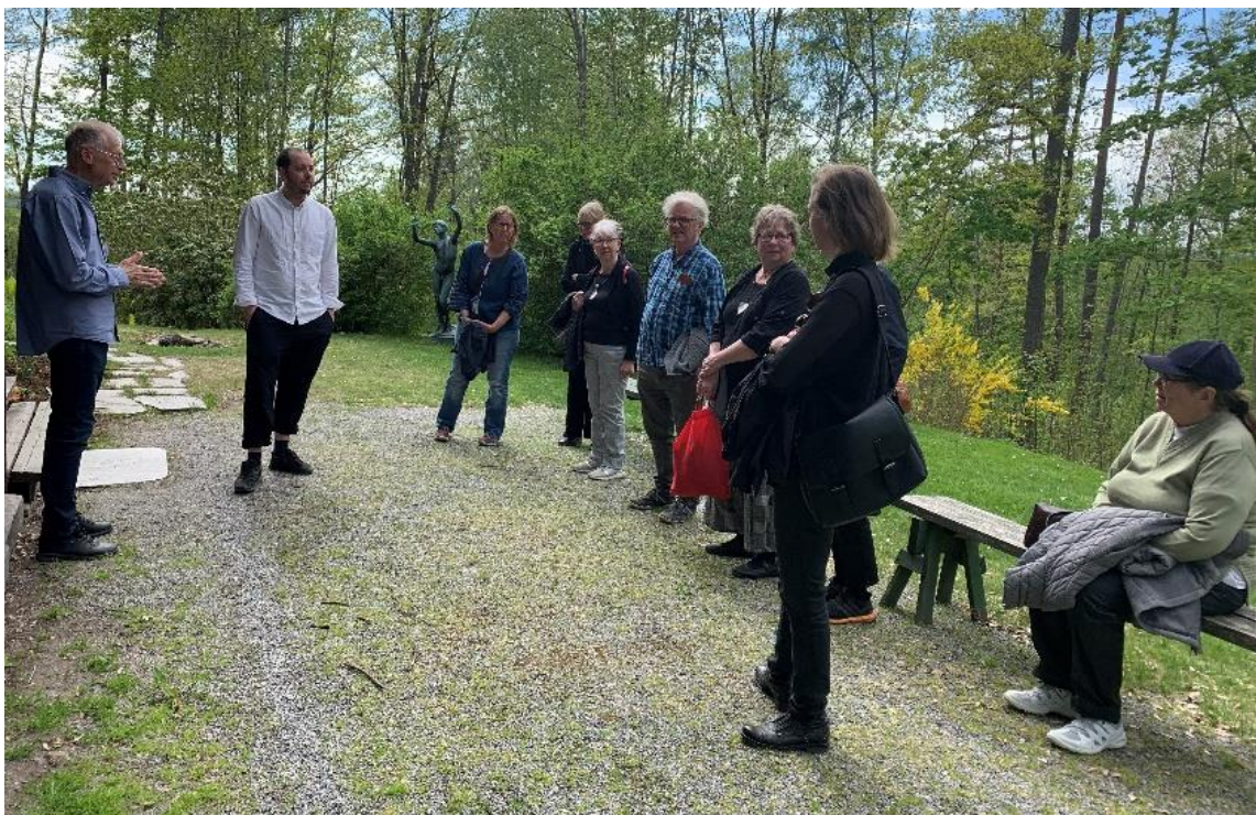
Guidad visning vid Oppstuhage