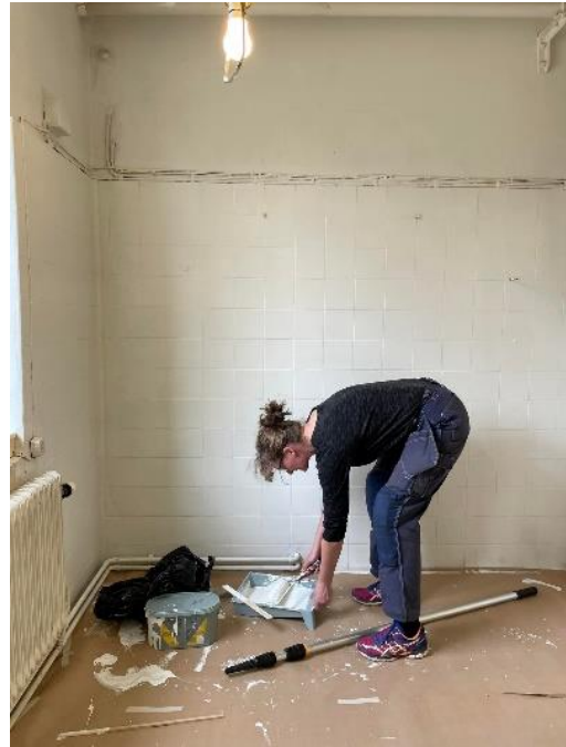
skura och måla