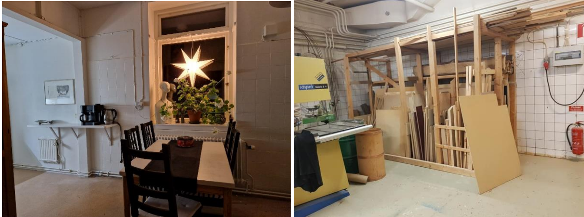
Så fint blev det efter många månader, veckor, dagar och timmars arbete!